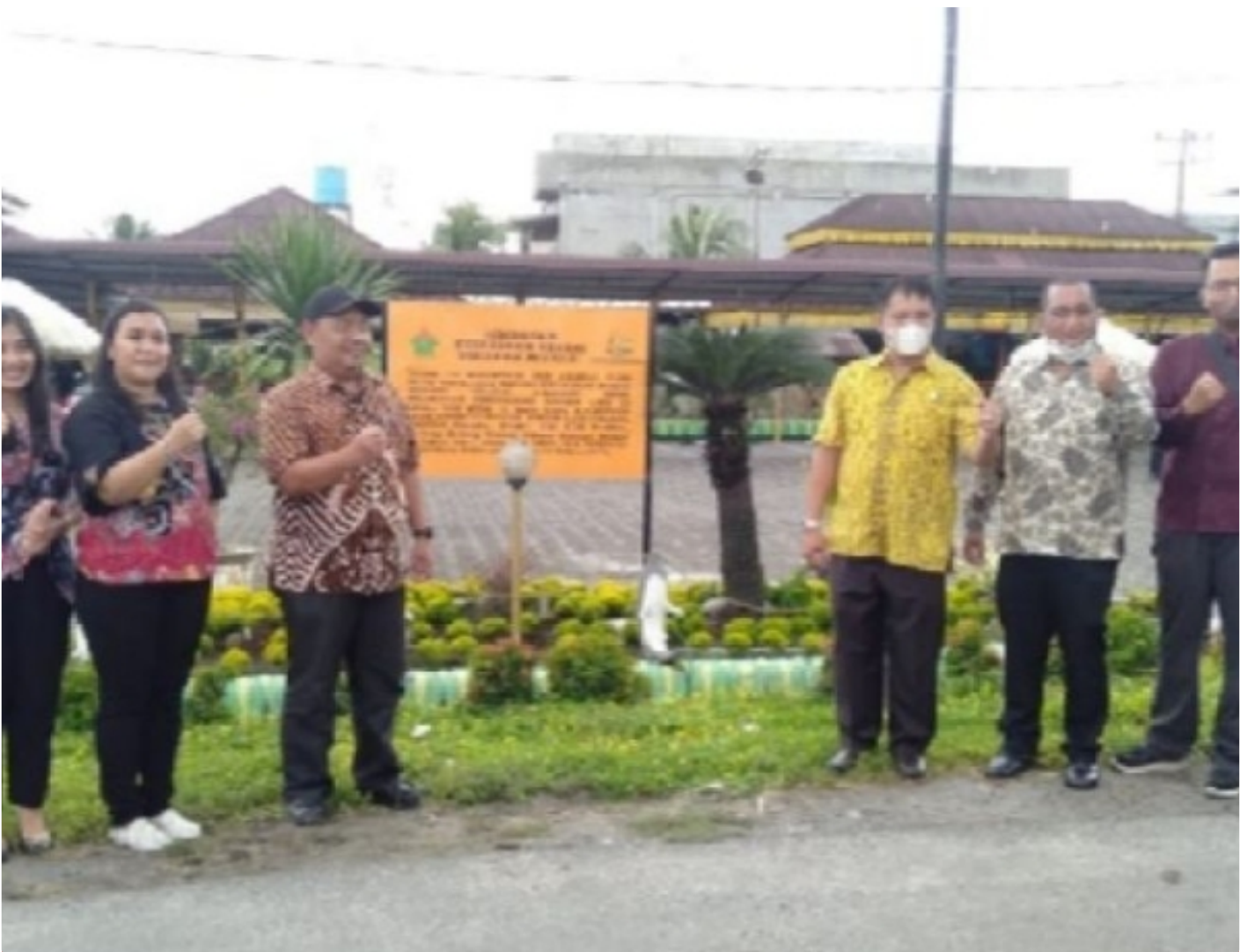
Photo Bersama Usai Pemasangan Plank Bertuliskan Soal HGU Milik PTPN IV

SERDANG BEDAGAI- Pengawasan dan pengamanan aset milik PT Perkebunan Nusantara IV Unit Kebun Adolina dilaksanakan oleh Kejaksaan Negeri Serdang Bedagai selaku pendamping hukum, terkait pendudukan lahan HGU.